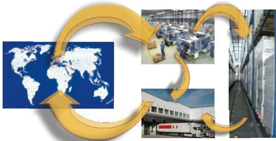
Lager- und Logistiklösung für Unternehmen in einem globalen Markt

Das Lager- und Logistik-System der f+s software bietet Sicherheit im gesamten Warenfluss von Produktions- und Handelsbetrieben; in Verbindung mit einem „chaotischen Lager“ und zum Erreichen höchstmöglicher Auslastung der Lagerkapazitäten, zur Erhöhung der Bestandssicherheit und zur Anhebung der Lieferqualität. iLoNa senkt den Personal- und Maschineneinsatz, nutzt die Möglichkeiten moderner IT-Systeme im Unternehmen und erhöht zugleich die Flexibilität für mehr Wettbewerbsfähigkeit.